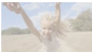
ALTERAÇÕES NAS CORES